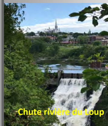
Chute rivière du Loup

l'état du Maine aux USA. Nous appelons les habitants de Rivière-du-Loup des Louperivois ou des Louperivoises. Jusqu'en 1919, la ville était connue sous le nom de Fraserville. Les chutes de la rivière du Loup sont un attrait touristique important. À l'époque, une centrale électrique y a été construite, ce qui a permis l'essor de nombreuses industries. (Source Wikipédia)