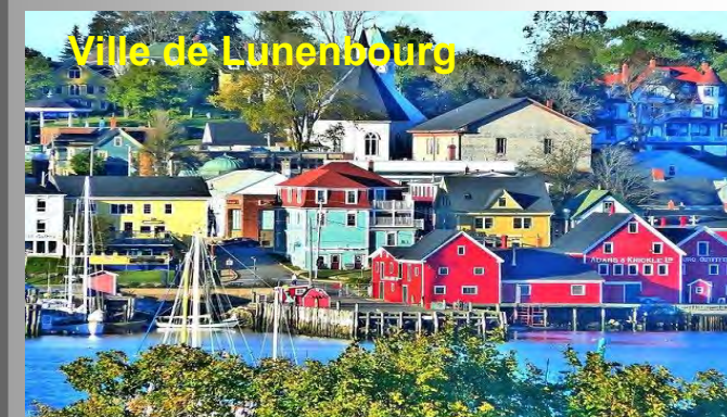
Ville de Lunenburg

La population est d'environ 2500 habitants. (source Wikipédia)