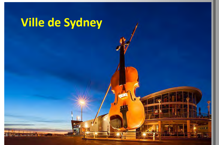
Ville de Sydney

Ville portuaire située sur l'île du Cap-Breton, en Nouvelle-Écosse, elle a été fondée en 1785. Durant la seconde guerre mondiale, Sydney était un port très important. De nos jours, plusieurs bateaux de croisières y accostent.