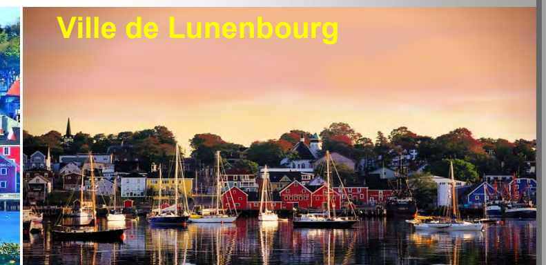
Ville de Lunenburg